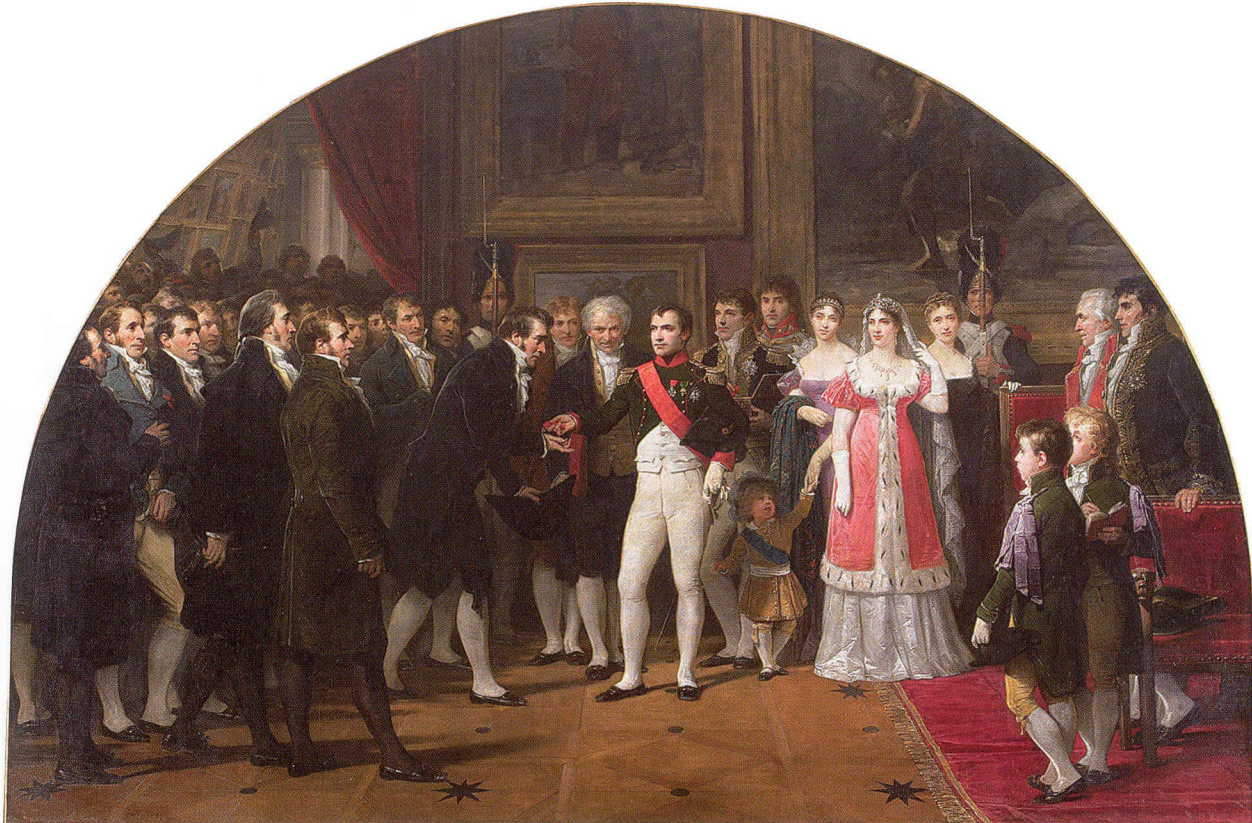
Adolphe Yvon (1817-1893) d'après Antoine-Jean Gros (1771-1835), Napoléon I er décore les artistes au salon de 1808 , 1875. Au centre, de gauche à droite, Jacques-Louis David, Dominique-Vivant Denon et Napoléon I er .