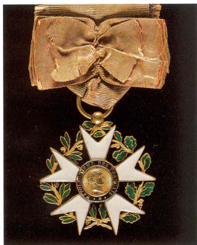
Aigle d'or conforme au modèle défini par le décret du 22 messidor an XII (11 juillet 1804). Avers et revers.