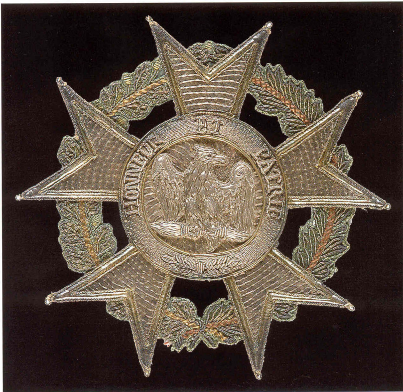
Plaque de grand aigle de la Légion d'honneur de Monseigneur Jean-Baptiste de Belloy (1709-1808), archevêque de Paris.

fre du contingent des grands-croix actuels : 75. Cette dignité supérieure complétait la hiérarchie de la Légion d'honneur et la rattachait plus étroitement aux ordres monarchiques européens. La grande décoration consistait en un ruban rouge passant de l'épaule droite au côté gauche auquel était appendue la grande étoile, et était complétée d'une plaque anglée de rayons, brodée en son centre d'un aigle. Les titulaires n'en portaient pas moins le petit aigle d'or à la boutonnière.