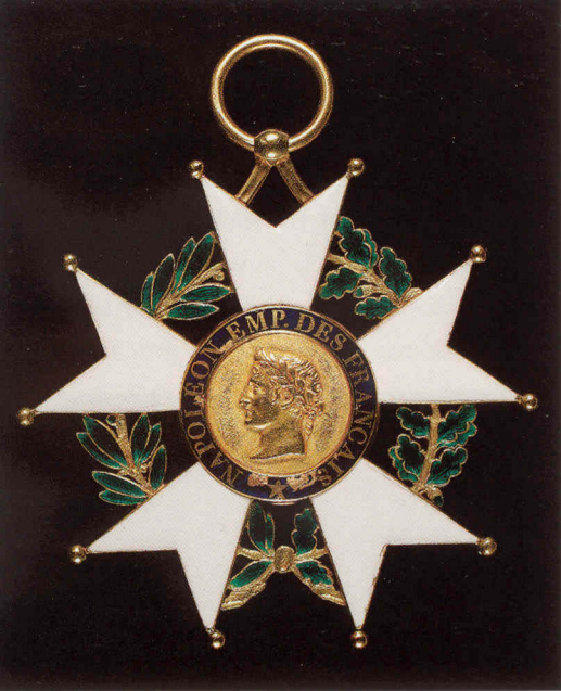
Insignes de grand aigle de la Légion d'honneur du maréchal Lannes (grande étoile et plaque).